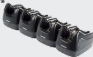
• 94A150037 Puits chargeur 4 positions • 94A150038 Puits Ethernet 4 positions